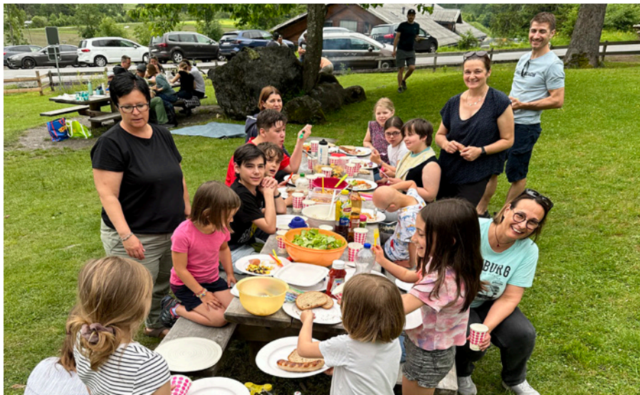
Gemütliches Beisammensein beim Grillplausch in Grüşch

Freies Spielen war auf dem grosszügigen Spielplatz in Grüşch angesagt. Ob Klettern, sich verstecken oder im Bächlein zu spielen, jedes Kind fand seinen Lieblingsplatz. Beim Grillen halfen alle mit und wir genossen ein sehr vielfältiges Buffett. Es wurde lange gespielt, bis uns ein erwarteter Regen dann doch nachhause schickte.