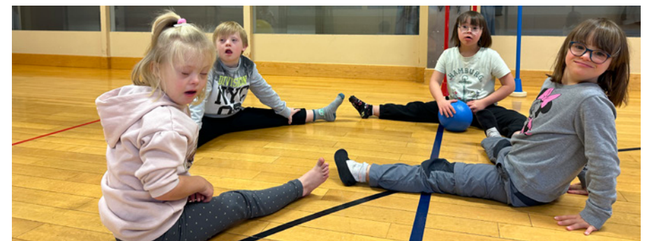
Teamgeist in der Turnhalle des Zentrums für Sonderpädagogik Giuvaulta