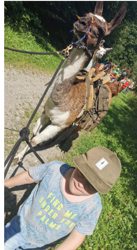
Impressionen unseres Lama-Trekking im Prättigau