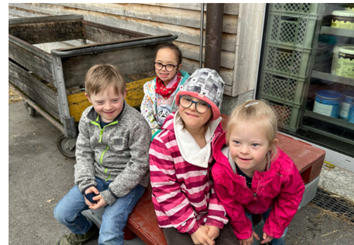
... auf dem Bauernhof Plankis

Der zweite Höhepunkt war ein Vortrag der PTA. Die PTA – Pfadi trotz Allem ist eine spezielle Abteilung der Pfadi für Kinder und Jugendliche mit Beeinträchtigung. Sie bietet bedürfnis- und ressourcenorientierte Aktivitäten an und gestaltet ein abwechslungsreiches Pfadi-Erlebnis. Gemeinsam die Natur zu erkunden, zu basteln und zu spielen steht bei der PTA auf dem Programm. Die PTA sendete zwei Beauftragte, um dieses tolle Freizeitangebot vorzustellen. Wir lauschten dem spannenden Vortrag und durften unsere Fragen dazu stellen. Es war eine sehr humorvolle und informative Darbietung. Wie schön, dass sich viele Kinder mit Beeinträchtigungen nun oft in der Pfadi sehen lassen.