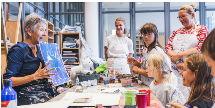
Malworkshop im Creaviva Museum Bern

Vielen herzlichen Dank für all euren Einsatz! Im Jahr 2025 wird sich die Region Bern erneut dem überregionalen Projekt anschliessen.