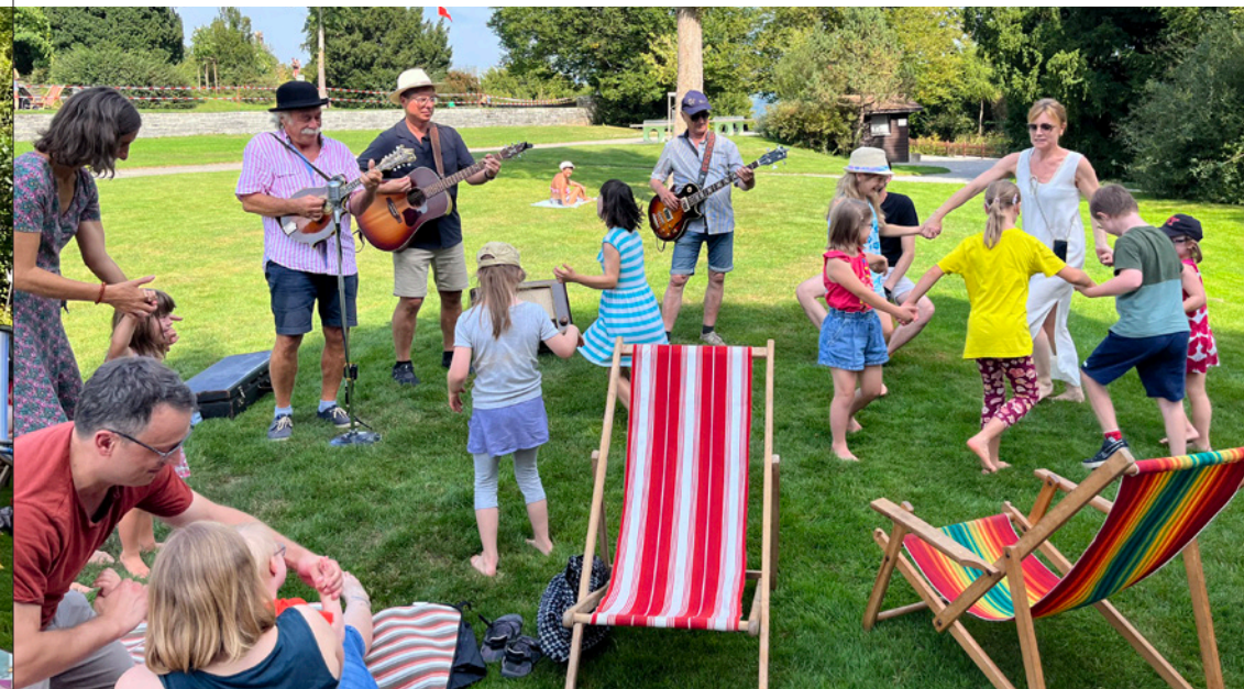
Sommernachmittag im Park im Grüene in Rüschtikon

Jedes Jahr verfliegt wieder, und unsere Kinder werden grösser und reifer. Manche Familien kommen neu dazu, manche beteiligen sich aktiver, andere weniger, an den angebotenen Aktivitäten. Aber es ist schön, Euch alle da draussen zu wissen!